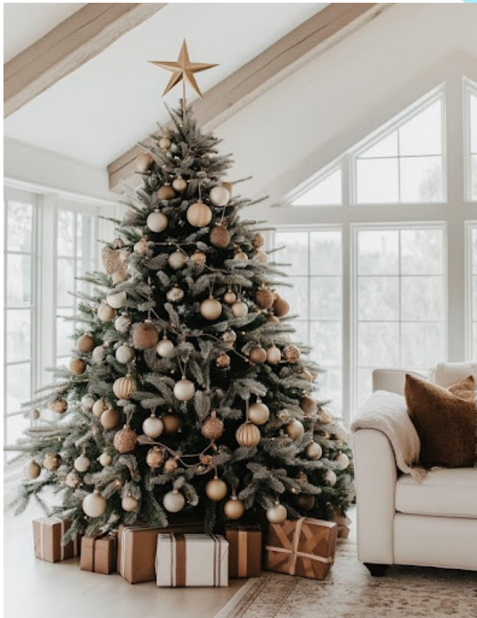
(Pilt: The White Laurel)

Vaheajal on paljud ilmselt plaaninud rohkem aega kodus veeta, seega ei tee paha soovitada mõnda toredat jõulufilmi, mis looks hea jõulumeeleolu. Jõulufilmide soovitamisest alustaksin alati klassikaga – “Üksinda kodus”. Tegemist on 1990. aasta komöödiafilmiga, millele on tehtud lausa viis järge. Soovitaksin veel mõnda huvitavat jõulukomöödiat: “Armastus on see”, “Jõulukroonikad”, “Deck the Halls” ja “Meet Me Next Christmas”.