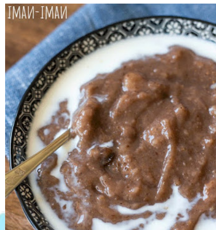
Pilt: Kaare Sova

Kooli sööklas ei ole toidu kombinatsioonide valik alati ideaalne, kuid mõnikord ulatub see tasemele, mis paneb kahtlema elu mõttes. Leivasupp ja kalasupp, kaks rooga, mis on eraldi juba üsna vastuolulised, olid meil serveeritud koos. See on tõeline kulinaarne katastroof. Alustame leivasupist. Selle tekstuur on lihtsalt rõve. See tume ja tükiline magus puder meenutab midagi, mis on köögis õnnetusena sündinud, mitte teadliku retsepti tulemus. Selle tooraineks on leib ja vesi. Mõte, et sellest kahest lihtsast koostisosast on mingi “magustoit” valmis keedetud, ajab kergelt judisema. Jah, ajalooliselt oli see lihtsa toidu sümbol – sõja- ja näljaajal tuli leida lahendusi, kuid tänapäeval, kui toiduvalik on lai, ei peaks me olema sunnitud sööma midagi, mis maitseb, nagu oleks see valmis pandud viimase hädaolukorra jaoks. Meil ei ole vaja nostalgilist meeldetuletust sellest, kuidas ellujäämiseks vett ja kuivanud leiba potti visata tuli. Siis tuleb mängu kalasupp. Iseenesest võiks see olla midagi mõnusat ja maitsvat, kui tegemist on värske kalaga ja hoolikalt valitud koostisosadega, kuid see, mida meile koolis serveeritakse, on sageli kaugel sellest. Lõhnalt liialt intensiivne ja maitseomadustelt pigem kalatööstusliku kõrvalproduktina tunduval