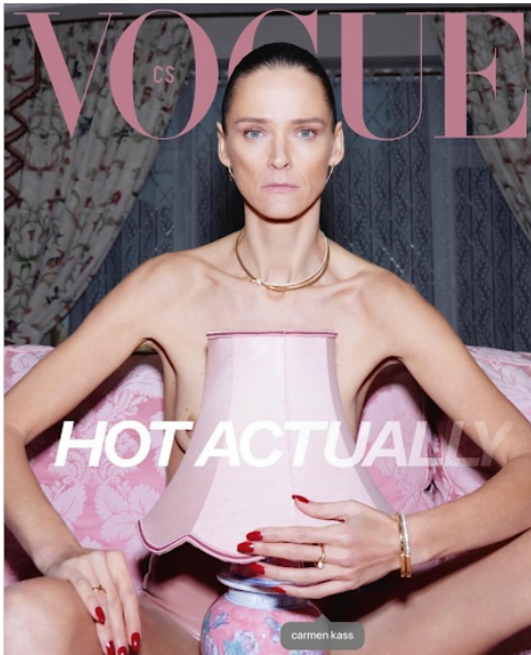
Carmen Kass Vogue'i esikaanel.

Kamala Harris on USA esimene naisasepresident ja esimene mustanahaline naine, kes on jõudnud sellesse kõrgesse ametisse. Tema teekond poliitikas ja tema pühendumus õiguste kaitsmisele ja võrdsusele on muutnud maailma. Kamala Harris on seisnud naiste õiguste, hariduse ja tervishoiu eest, olles igal sammul eeskujuks neile, kes tahavad oma häält kuulda anda ja muuta maailma paremaks paigaks.