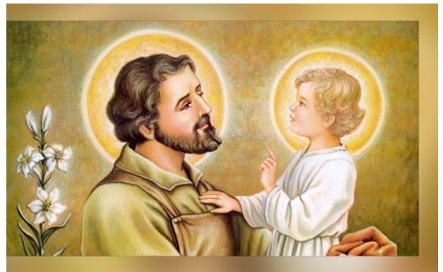
Püha Joosepi päev on 19. märtsil.

Kuna Joosep oli puusepp ja aus töömees, pöörduakse tema poole ka finantsilise turvalisuse palumiseks.