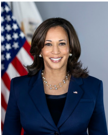
Kamala Harris asepresidendina.

Kamala Harris on USA esimene naisasepresident ja esimene mustanahaline naine, kes on jõudnud sellesse kõrgesse ametisse. Tema teekond poliitikas ja tema pühendumus õiguste kaitsmisele ja võrdsusele on muutnud maailma. Kamala Harris on seisnud naiste õiguste, hariduse ja tervishoiu eest, olles igal sammul eeskujuks neile, kes tahavad oma häält kuulda anda ja muuta maailma paremaks paigaks.